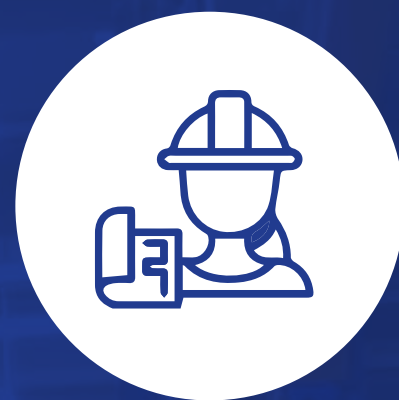
Gestor de tu propia empresa de operación logística