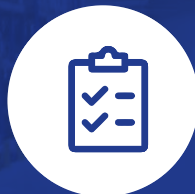
Planeación logística y compras