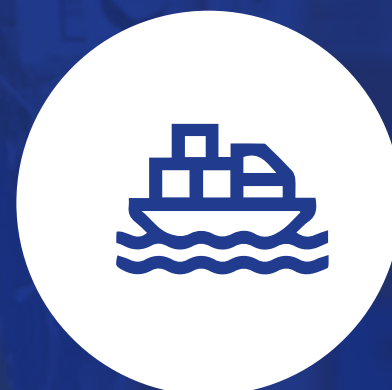
Importaciones y/o exportaciones