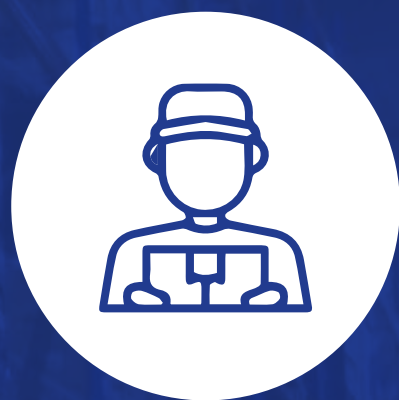
Líder de la distribución física internacional

Podrás gestionar con calidad la cadena logística en procesos relacionados con abastecimiento de mercancías, producción, almacenamiento, transporte, inventarios, distribución de bienes y servicios. Esto te permitirá hacer parte de uno de los sectores de mayor crecimiento, con proyección nacional e internacional.