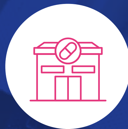
Administrador de agencias

También puedes ser asistente técnico en: