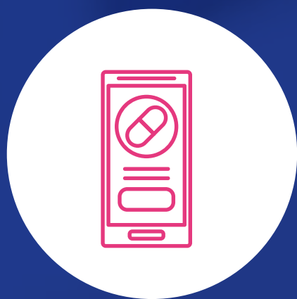
Auditor interno y externo

Te puedes desempeñar en establecimientos farmacéuticos como: