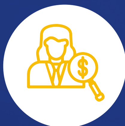
Audidores financieros y contables