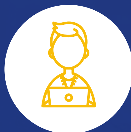
Auxiliares de servicios financieros