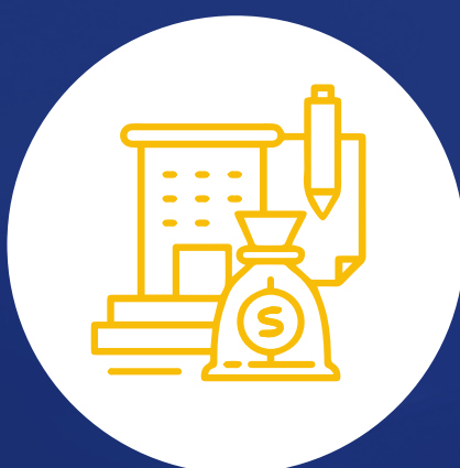
Asistentes de tesorería