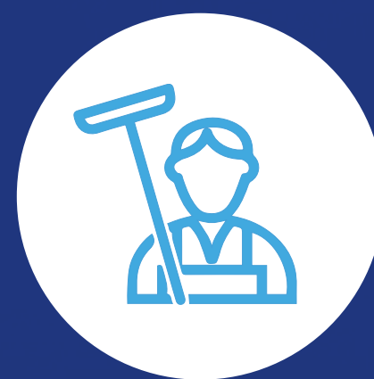
Empleado servicio al huésped