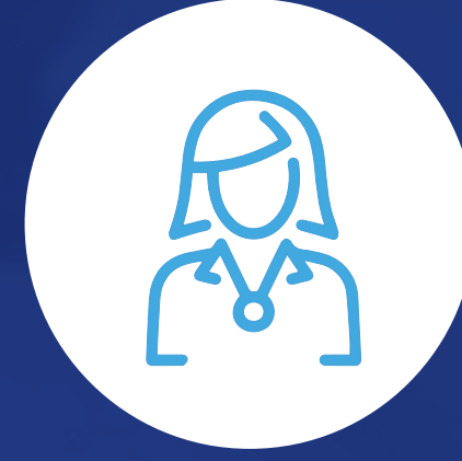
Conserje de alojamiento