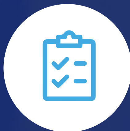
Inspector de seguridad y salud