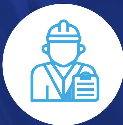
Especialista de calidad

El enfoque se centra en la excelencia operativa y el bienestar de las personas. Asegura productos y servicios de alta calidad para prevenir accidentes y enfermedades laborales. Además, promueve un entorno saludable minimizando el impacto ambiental de las operaciones en las empresas.