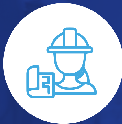
Especialista en seguridad laboral