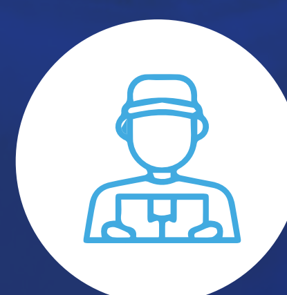
Consultor en calidad y seguridad