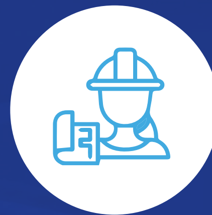
Especialista en salud ocupacional