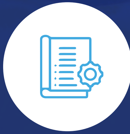
Coordinador de cumplimiento regulatorio