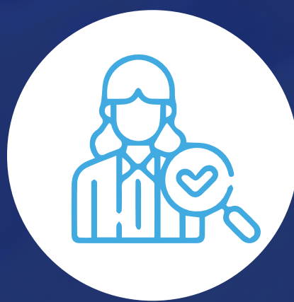
Auditor de calidad y seguridad