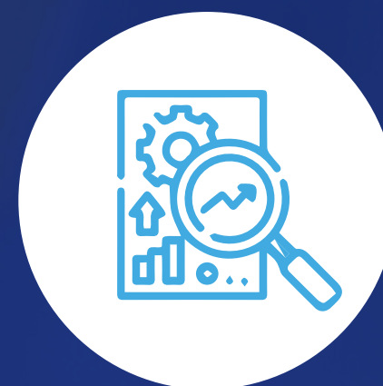
Analista de datos ambientales