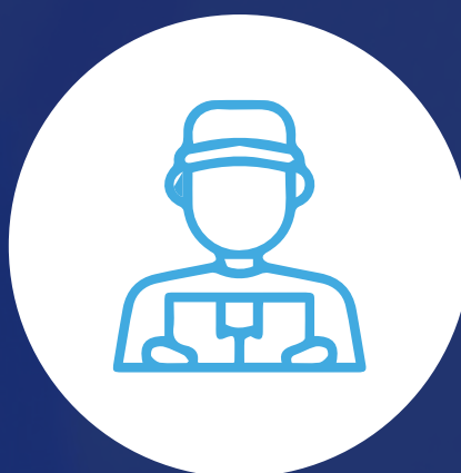
Especialista en gestión de riesgos